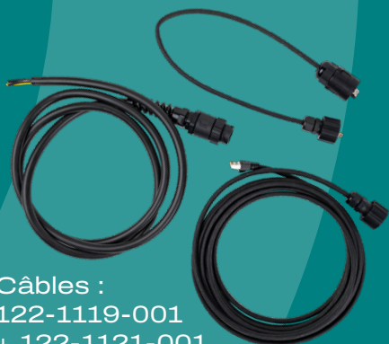
Câbles : 122-1119-001 + 122-1121-001 + 122+1117-001